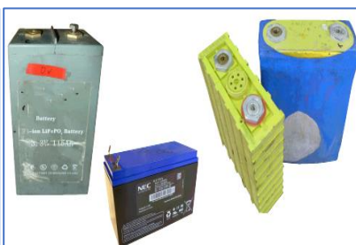
Figur 2; Li-ion industribatteri