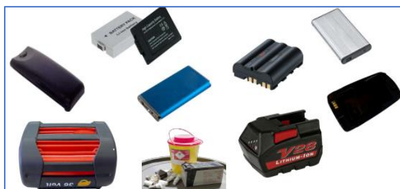
Figur 1; Portable li-ionbatteri

Li-ionbatterier er oppladbare litiumbaserte batterier med mange bruksområder, som eksempelvis til mobiltelefoner, verktøy, PCer og leker. Det benyttes stadig mer li-ionbatteri grunnet den lange levetiden og lave vekten. Det er svært viktig at batteriene emballes korrekt ved destruksjon, grunnet stor brannfare knyttet til litiumbaserte batterier.