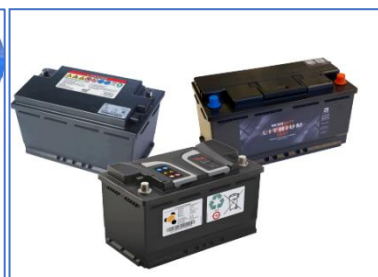
Figur 3; Li-ion startbatteri